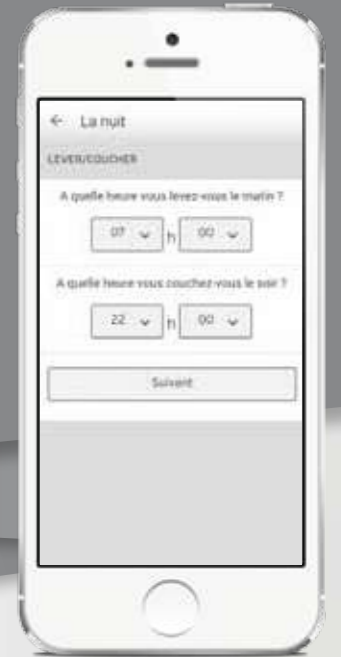
Réglage de la programmation