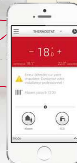
Rappel des besoins de maintenance