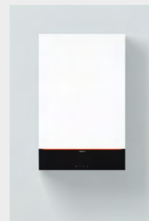
Vitodens 222-W (Type B2LH)

Puissance de production d'eau chaude sanitaire pour un chauffage de l'eau potable de 10 à 45 °C.