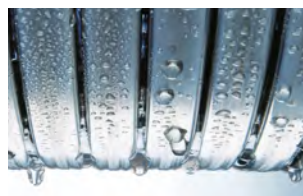
Échangeur de chaleur Inox-Radial

L'acier inoxydable fait la différence. L'échangeur de chaleur Inox-Radial en acier inoxydable résistant à la corrosion est le cœur de la Vitodens 222-W. Il transforme l'énergie utilisée en chaleur de manière particulièrement efficace. Pratiquement sans perte, avec un rendement de 98 %, difficile à surpasser. Et ce, avec la sécurité d'un acier inoxydable de haute qualité particulièrement durable et de haute qualité.